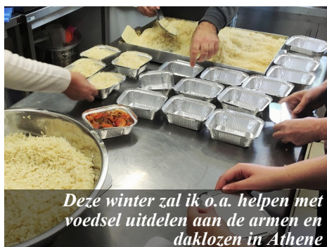
Deze winter zal ik o.a. helpen met voedsel uitdelen aan de armen en daklozen in Athene

Ruim 90% van de Grieken is Orthodox, slechts een heel klein deel hiervan leeft echt vanuit relatie met God.