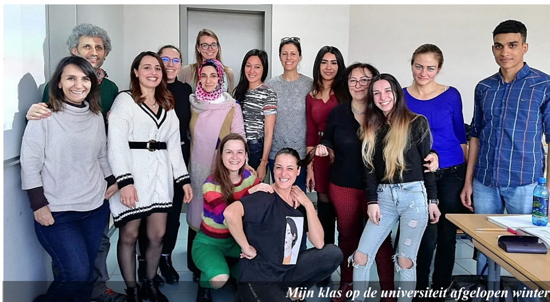
Mijn klas op de universiteit afgelopen winter

Ik heb er zin in om weer lekker concreet aan de slag te gaan en nieuwe mensen te leren kennen! Deze zomer was heerlijk om weer even op te laden, nu wordt het langzaam weer tijd dat wat ik ontvangen heb door te geven!