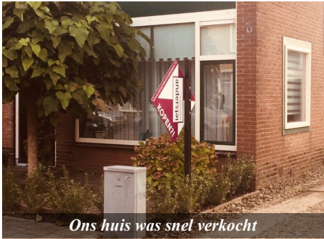
Ons huis was snel verkocht

De liefde die we alleen kunnen ontvangen en uitdelen wanneer die uit God is. “Laten we elkaar liefhebben, want de liefde is uit God en ieder die liefheeft is uit God geboren en kent God.” 1 Johannes 4:7