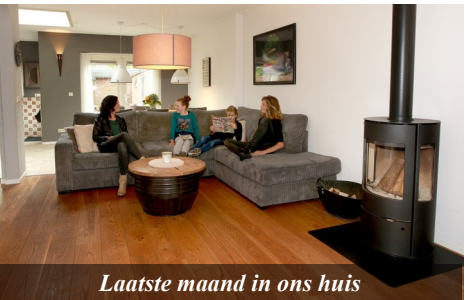
Laatste maand in ons huis