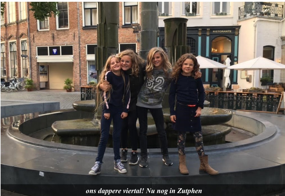
ons dappere viertal! Nu nog in Zutphen