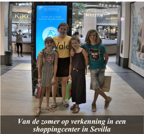
Van de zomer op verkenning in een shoppingcenter in Sevilla