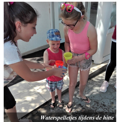
Waterspeltjes tijdens de hitte