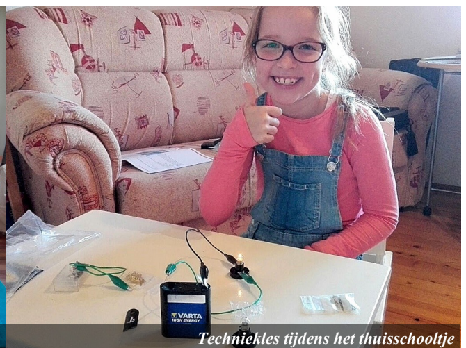
Techniekes tijdens het thuis-schooltje