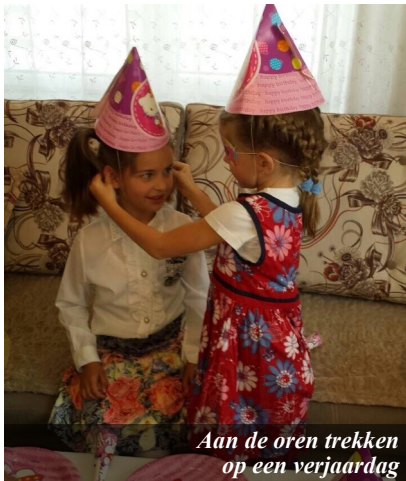
Aan de oren trekken op een verjaardag

In de nieuwsbrief voor de grote mensen staan ook altijd dingen om voor te bidden en voor te danken. Willen jullie ook bidden voor ons? Soms vinden we het nog best lastig dat we niet zomaar even langs opa en oma kunnen gaan of kunnen spelen bij onze Nederlandse vriendjes en vriendinnetjes of dat dingen hier in Kosovo heel anders gaan, vooral op school. Toch zijn we ook heel blij met zoveel leuke buurtkinderen, de fijne kerk en de postbus die heel vaak gevuld is. Willen jullie hier ook allemaal voor danken? En willen jullie er vooral voor bidden dat we een Lichtje zullen zijn voor de kinderen om ons heen, dat we Gods liefde mogen uitstralen als er soms zoveel duisternis en storm is?