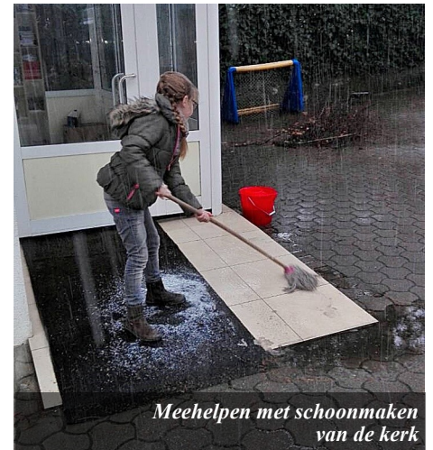
Meehelpen met schoonmaken van de kerk