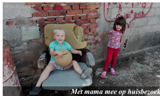
Met mama mee op huisbezoek