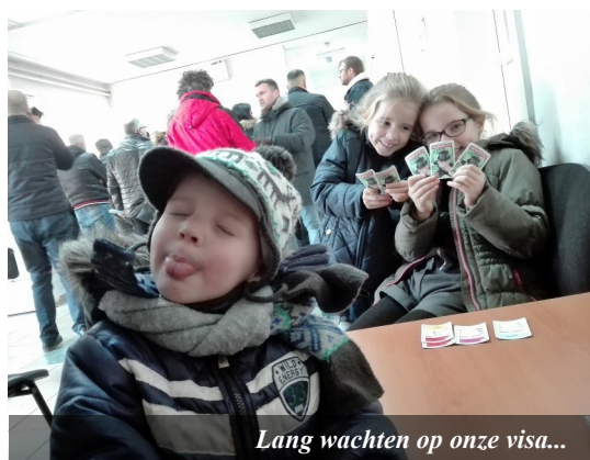
Lang wachten op onze visa...

In deze kindernieuwsbrief geven we weer antwoord op vier vragen: wat vind je leuk, wat vind je niet leuk, wat vind je moeilijk en wat vind je mooi in Kosovo?