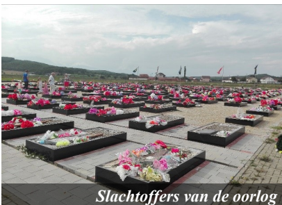
Slachtoffers van de oorlog