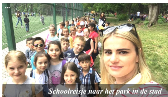
Schoolreisje naar het park in de stad