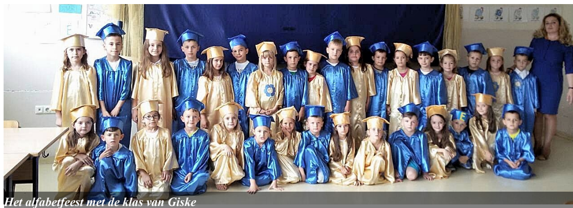
Het alfabetfeest met de klas van Giske