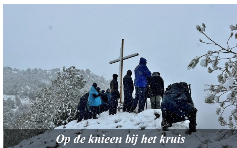
Op de knieën bij het kruis