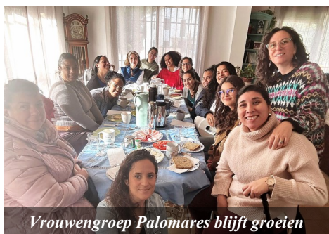
Vrouwengroep Palomares blijft groeien