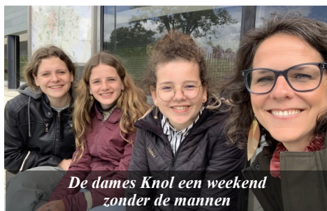
De dames Knol een weekend zonder de mannen