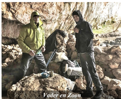
Vader en Zoon