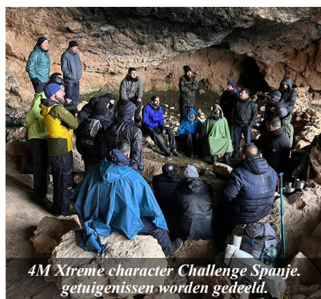
4M Xtreme character Challenge Spanje. getuigenissen worden gedeeld.