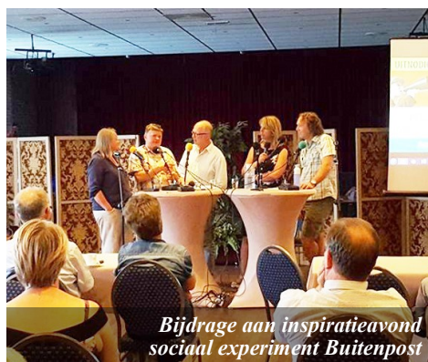
Bijdrage aan inspiratieavond sociaal experiment Buitenpost