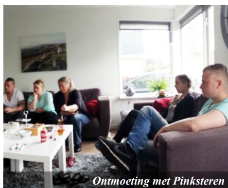
Ontmoeting met Pinksteren

Op de derde zondag van de maand houden we ‘de Verdieping’. Zoals de naam al zegt, gaat dan de Bijbel open en gaan we meer de diepte in met de deelnemers. Vaak zijn dit zoekers of jonggelovigen met wie je de mooiste en intensiefste gesprekken hebt. Zo hebben we op de zondag voor Pasen mogen uitleggen wat de betekenis van het sterven en de opstanding van Jezus voor ons is. En toen we aan alle aanwezigen vroegen of ze zich daar ook van bewust waren, heeft één van hen voor het eerst mogen getuigen van een keuze voor Jezus.