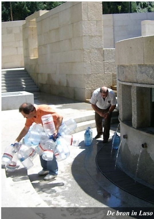
De bron in Luso

In onze tuin staan veel fruitbomen. In de zomerperiode is alles bijna tegelijk rijp. Dat betekent op meerdere dagen fruit plukken, het fruit schoonmaken en in stukjes snijden.