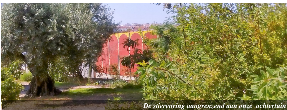
De stierenring aangrenzend aan onze achtertuin