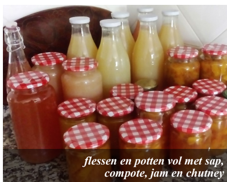
flessen en potten vol met sap, compote, jam en chutney

Wij hebben met enkele collega's van ECM iedere twee weken een 'huddel'. Dit is een Skype-ontmoeting, waarin we onder leiding van de 'huddelleider' samen bidden, stil zijn om te luisteren naar de Heilige Geest, in alle openheid fijne en minder fijne dingen met elkaar delen, elkaar bevragen en elkaar bemoedigen. Ook al zitten we allemaal op verschillende plaatsen in Europa, toch loop je tegen dezelfde dingen aan. Wij voelen ons zeer bemoedigd door deze 'huddels'.